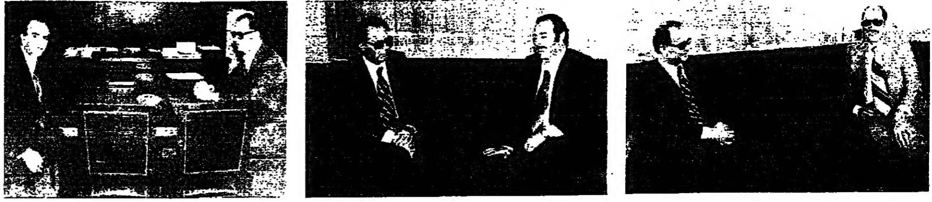
رئيس الحكومة مع السفير على الشامر .. ومسح السفير عبد الحميد البيجان .. واجتماع مع الدكتور صلاح سلمان